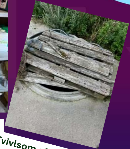
Tvivlsom afdækning af brønd