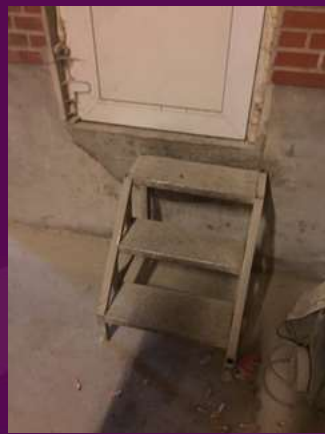
Trappe fra foderlade