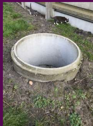
Åben brønd ved gylletank