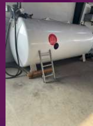
Defekt stige ved dieseltank