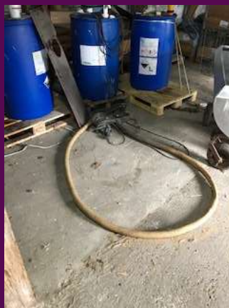
Løs slange på gulv