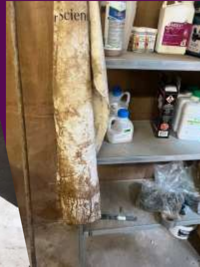
Forklæde i kemirum