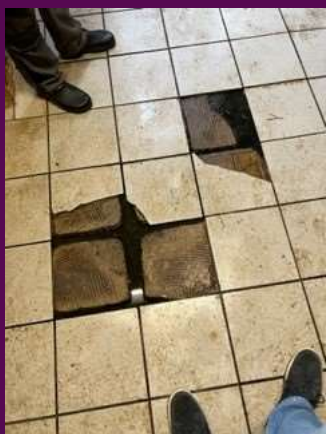
Manglende fliser i malkerum