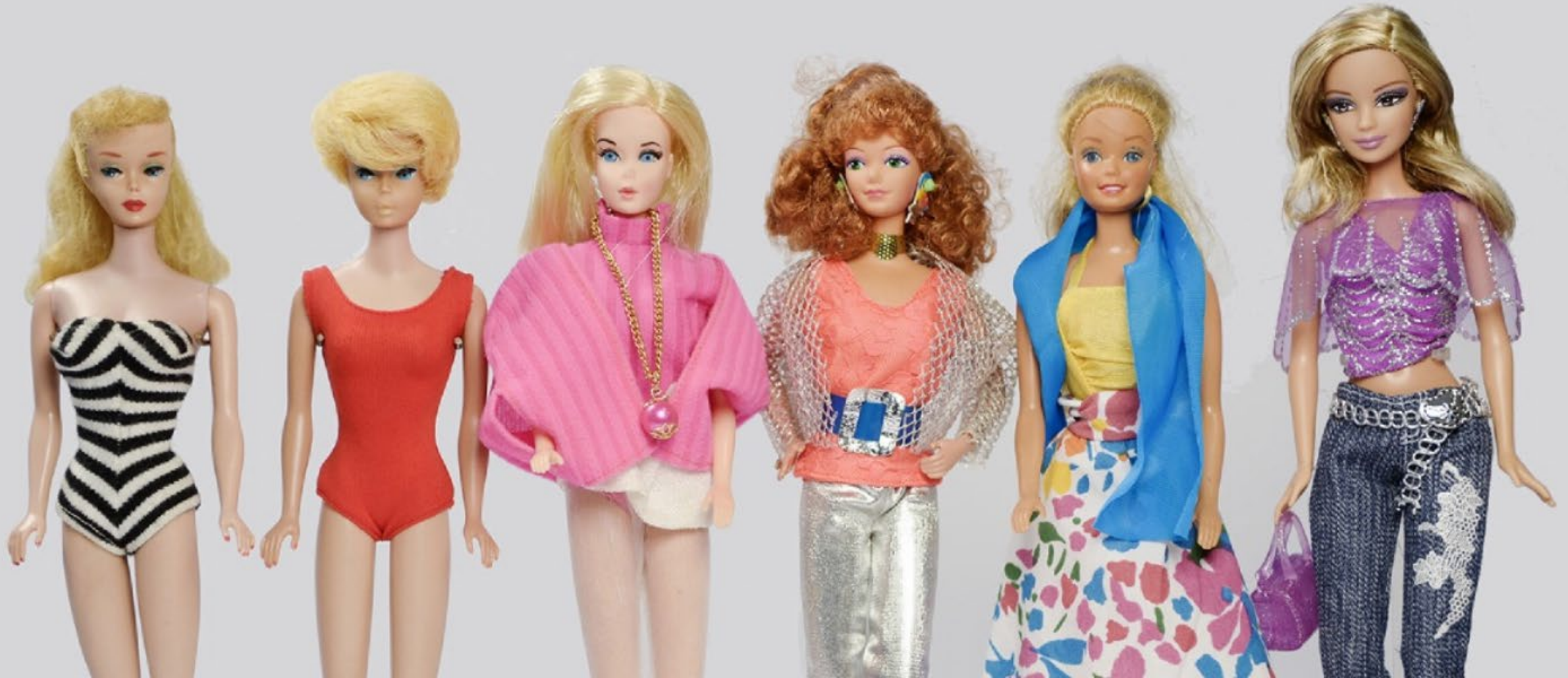
8. marts 2019